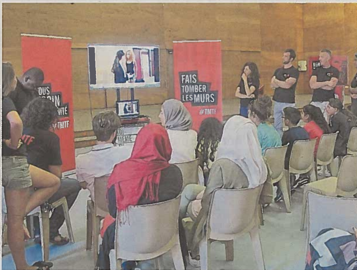
YouTube France propose les 1er et 2 août prochains d'accompagner les jeunes dans la réalisation de vidéos sur le thème de la fraternité.

Cet été, Toi-même tu filmes repart donc pour une nouvelle tournée dans toute la France, et sera présent pour la première fois à Reims. L'an dernier, ce sont plus de 200 vidéos qui ont été réalisées dans une cin-