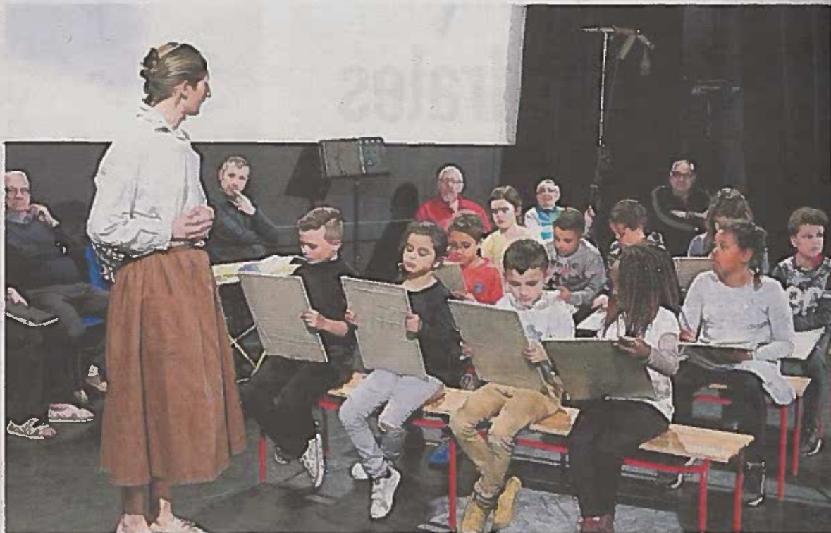
Les élèves du périscolaire en répétition au Ludoval aux côtés des résidents de l'Arfo et des comédiens de la compagnie Cage de scène.